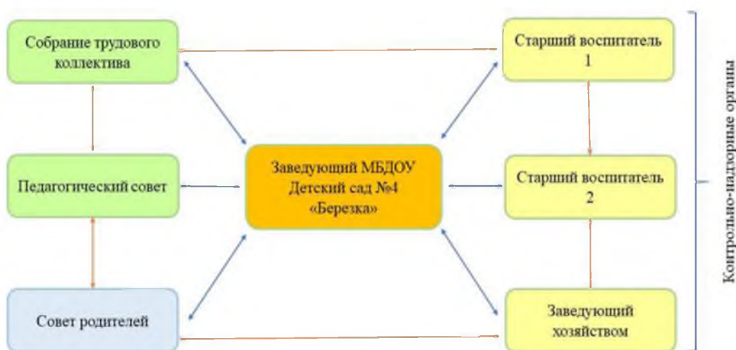
Структура взаимодействия органов управления МБДОУ Детский сад №4 «Березка»

В ДОО действует Профсоюз работников это добровольное объединение работников (педагогов, преподавателей, сотрудников администрации и вспомогательного персонала), целью которого является защита профессиональных, трудовых, социальных прав и законных интересов членов профсоюза. Профсоюз работников ДОО является активным участником всех муниципальных мероприятий Профсоюза образования г. Чайковский.